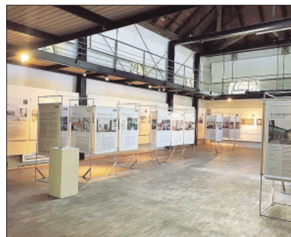
Wanderausstellung im Architektur Haus Kärnten